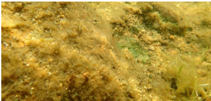
Périphyton fixé sur des roches

la rive et par l'apport en phosphore. Si un apport externe survient dans le lac, il atteint d'abord la zone près des rives. La mesure de l'épaisseur du périphyton dans la partie peu profonde du lac est donc considérée comme premier indicateur de la détérioration d'un système lacustre (Lambert, et al., 2008).